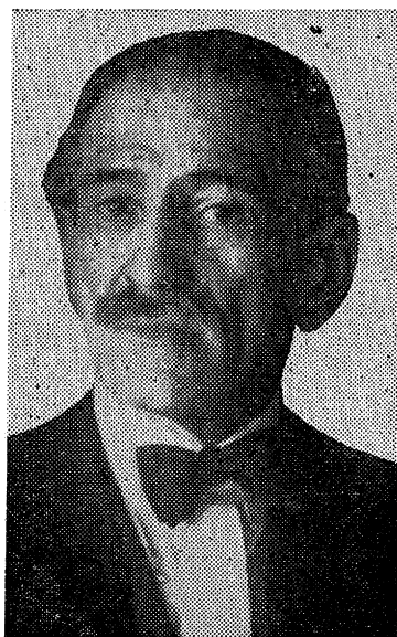
אברהם רייזען (צו זעכציק יאַר)